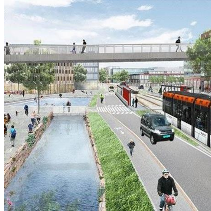
Slik kan det bli ved Mindemyren